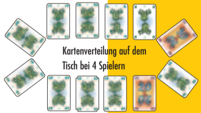
Kartenverteilung auf dem Tisch bei 4 Spielern

Die Hornochsenkarten auf der Hand werden in aufsteigender Reihenfolge sortiert. Die Hornochsenkarten auf dem Tisch werden in aufsteigender Reihenfolge im Uhrzeigersinn sortiert. Jede einzelne Karte des Kartenkreises auf dem Tisch ist die erste Karte einer Reihe. Die restlichen Karten werden aus dem Spiel genommen.