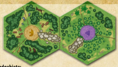
2 Jagdgebiete: Wild (links) und Beeren (rechts) mit jeweils 3 benachbarten Feldern.

Anmerkung: Wir wissen, dass man Beeren nicht jagt und das Fische, Mammuts und Wild selten auf Erntefeldern bereit liegen. Zur Vereinfachung werden trotzdem diese einheitlichen Begriffe für die »Jagd«, die »Jagdgebiete« und die dazugehörige »Ernte« und »Erntefelder« verwendet.