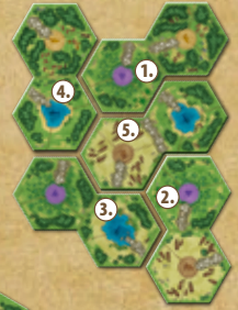
Für 5 Spieler