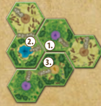
Für 3 Spieler