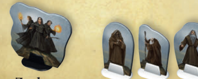
Zauberer des Feuers 3 x Zauberer des Turms