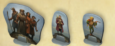
1 x Taren Merrik Grenolin