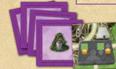
36 Druidenplättchen (mit violetter Rückseite)

Wichtig! Legt die Landschaftsplättchen dieser Erweiterung, die so genannten Druidenplättchen, nicht in den Stoffbeutel, sondern haltet sie getrennt von den Landschaftsplättchen des Grundspiels!