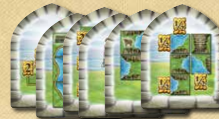
6 neue Wertungsplättchen

Nehmt euch ein „50/100 Siegpunkte“-Plättchen und dreht es auf die richtige Seite, wenn ihr 50 bzw. 100 Siegpunkte erreicht.