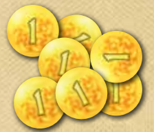
9 zusätzliche Goldmünzen