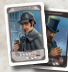
2 Rollenkarten (Sherlock und Moriarty)