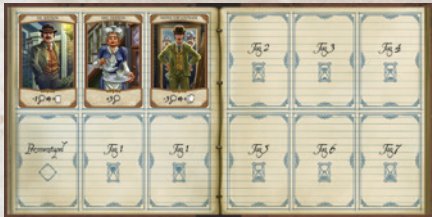
1 Spielplan (mit Rundenanzeiger)