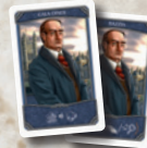
2 Mycroft-Karten für die Mycroft-Variante (Seite 7)