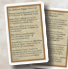
2 Übersichtskarten für die Personenfähigkeiten