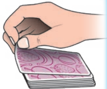
Aufdecken einer Karte

Seite nach vorne) von sich weg umgedreht. Je schneller die Bewegung, desto schneller sieht man auch selbst die offene Karte.